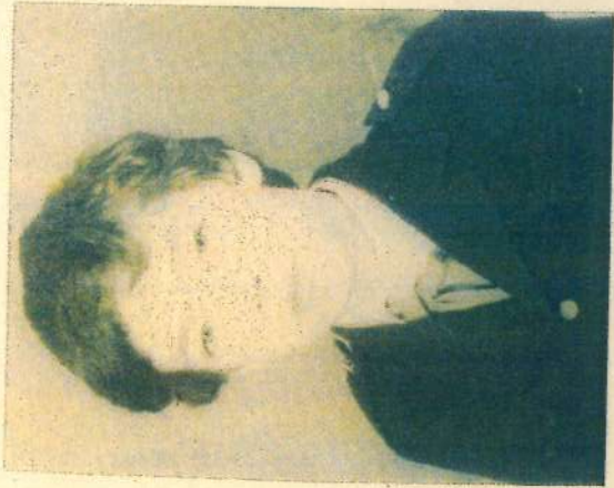
ГИРХ' [в детстве]

ОТКУДА: ул. Грушевская, дом 19, кв. 37, г. Новочеркасск, Ростовская обл., Россия, 346406.